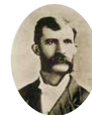
創業者 C.S.ロング博士

1880年1月のある夜、日本へと旅立つ宣教師カロール・サマーフィールド・ロングと新妻のために、母校テネシーウエスレヤン大学で開かれた祈りの会でのこと。老婦人が2人に2枚の銀貨を手渡して言った。「日本の若い人々を教育する資金に加えてください」。1881年10月23日、2人は長崎の丘に校舎を建て、献金してくださった元大学長カブリー博士未亡人の恩に報いるために、「カブリー英和学校」と命名。ここから、鎮西学院の歴史は始まった。