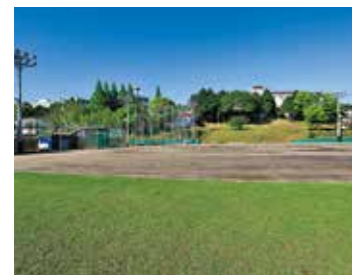
野球専用グラウンド