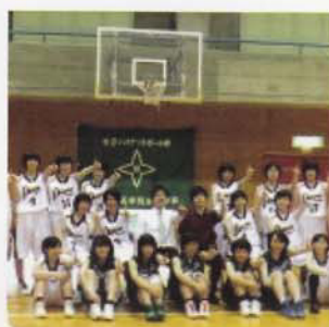
Câu lạc bộ Bóng rổ (Nữ)