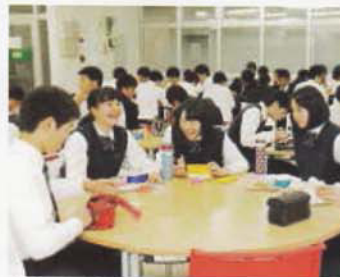
Phòng tự học