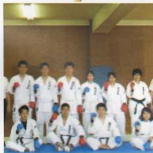
Câu lạc bộ Karate