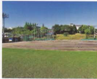
Sân bóng chày