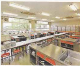
Phòng nữ công