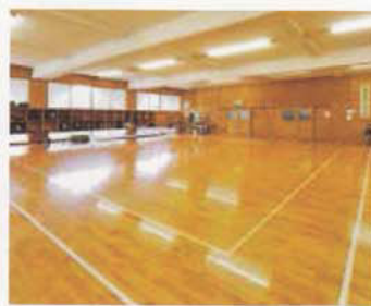
Phòng kiếm đạo