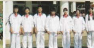
Câu lạc bộ Thể dục dụng cụ