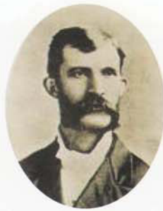
Tiên sỹ C.S. Long

Trường THPT Chinzei Gakuin được thành lập vào năm Minh Trị thứ 14 (tức năm 1881) bởi tiên sỹ C.S. Long - người thuộc giáo hội Methodist ở Bắc Mỹ được cử đến Nagasaki. Phương châm giáo dục của trường được hình thành dựa trên các nguyên tắc của Kito giáo. Học sinh cần có lòng kính trọng đối với Thiên Chúa, sống và yêu thương con người theo tinh thần "Kính thiên ái nhân". Trong hơn 135 năm kể từ khi thành lập tới nay, nhà trường luôn bồi dưỡng cho các em học sinh về tâm hồn, dạy các em học sinh biết yêu bản thân mình, yêu những người xung quanh. Sau 3 năm học tập dưới mái trường Chinzei Gakuin, mỗi học sinh đều mang trong mình trái tim trong sáng, trở thành một công dân có ích cho xã hội.