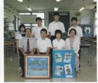
Câu lạc bộ Mỹ thuật