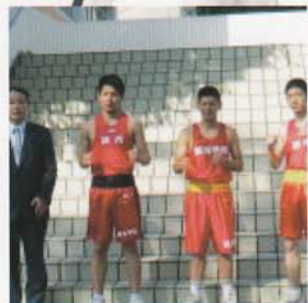
Câu lạc bộ Quyền anh