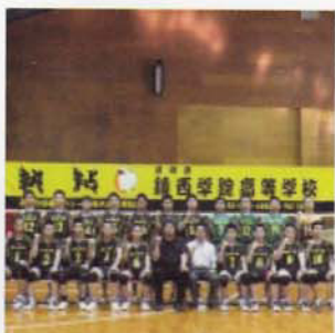
Câu lạc bộ Bóng chuyền (Nam)

Hoạt động câu lạc bộ giúp các em học sinh rèn luyện cơ thể và trí óc, tăng cường tinh thần đồng đội, tình bạn thân thiết. Trường THPT Chinzei trang bị hệ thống sân tập rộng lớn cùng các thiết bị thể thao hiện đại, đáp ứng nhu cầu sử dụng đa dạng của các câu lạc bộ. Quý phụ huynh, học sinh vui lòng xem thành tích mới nhất của các câu lạc bộ tại trang blog.