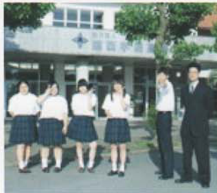
Câu lạc bộ Nhiếp Ảnh