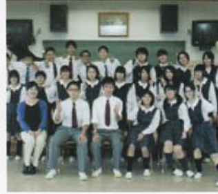
Câu lạc bộ Hợp Xướng