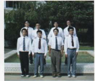
Câu lạc bộ Kịch