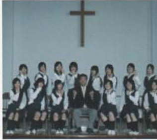
Câu lạc bộ Nhạc cụ bộ khí

Quý phụ huynh, học sinh có thể xem thành tích mới nhất của các câu lạc bộ tại trang blog.