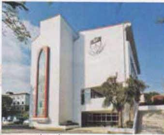
Nhà truyền thông