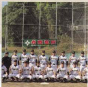
Câu lạc bộ Bóng chày