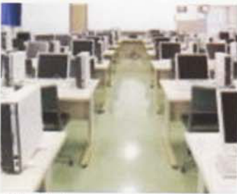
Phòng tin học