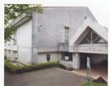
Nhà thể chất