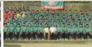
Câu lạc bộ Bóng đá (Nam)