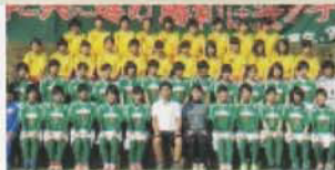
Câu lạc bộ Bóng đá (Nữ)