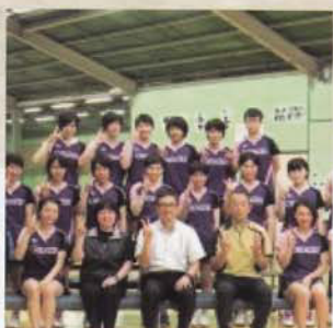
Câu lạc bộ Bóng bàn (Nữ)