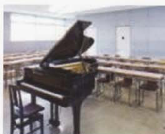
Phòng âm nhạc