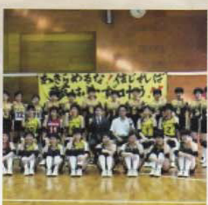
Câu lạc bộ Bóng chuyền (Nữ)