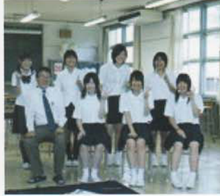
Câu lạc bộ Thư Pháp