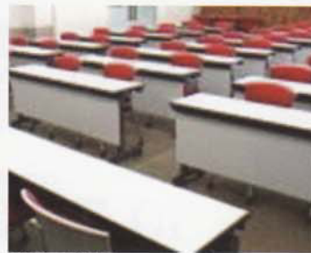
Phòng hội thảo