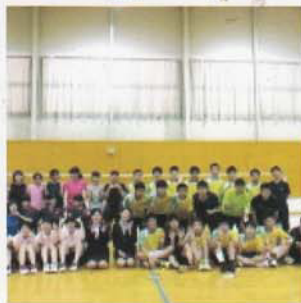
Câu lạc bộ Cầu lông