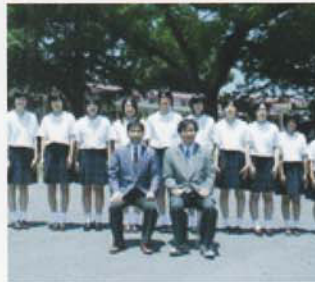
Câu lạc bộ Interact (*1)