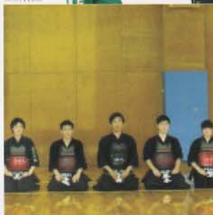
Câu lạc bộ Kiếm đạo