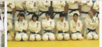
Câu lạc bộ Judo (Nam)