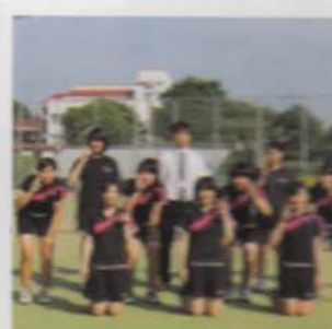
Câu lạc bộ Tennis (Nữ)