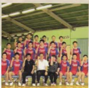
Câu lạc bộ Bóng bàn (Nam)