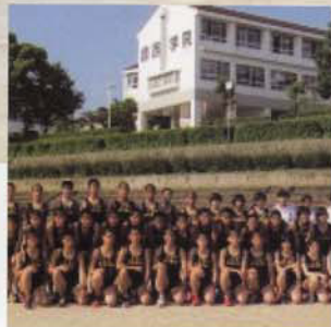
Câu lạc bộ Điền kinh (Nam/Nữ)