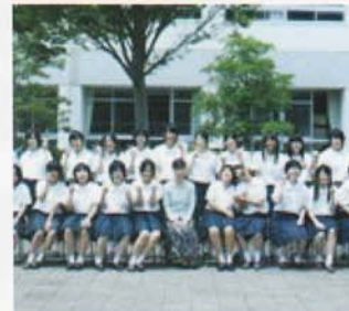
Câu lạc bộ Nữ công gia chánh