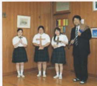
Câu lạc bộ H I - Y