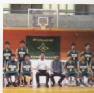
Câu lạc bộ Bóng rổ (Nam)