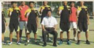
Câu lạc bộ Tennis (Nam)