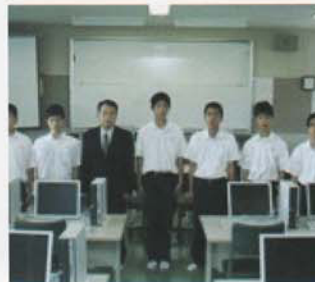
Câu lạc bộ Thông Tin & Truyền Thông